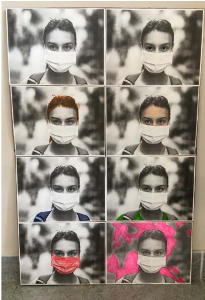
Création de Heliot, 5 e orange